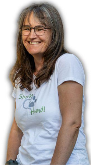
Artikel von Christiane Jacobs