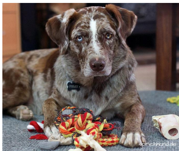
Pfote drauf - zeigt auch oftmals, dass der Hund etwas behalten möchte